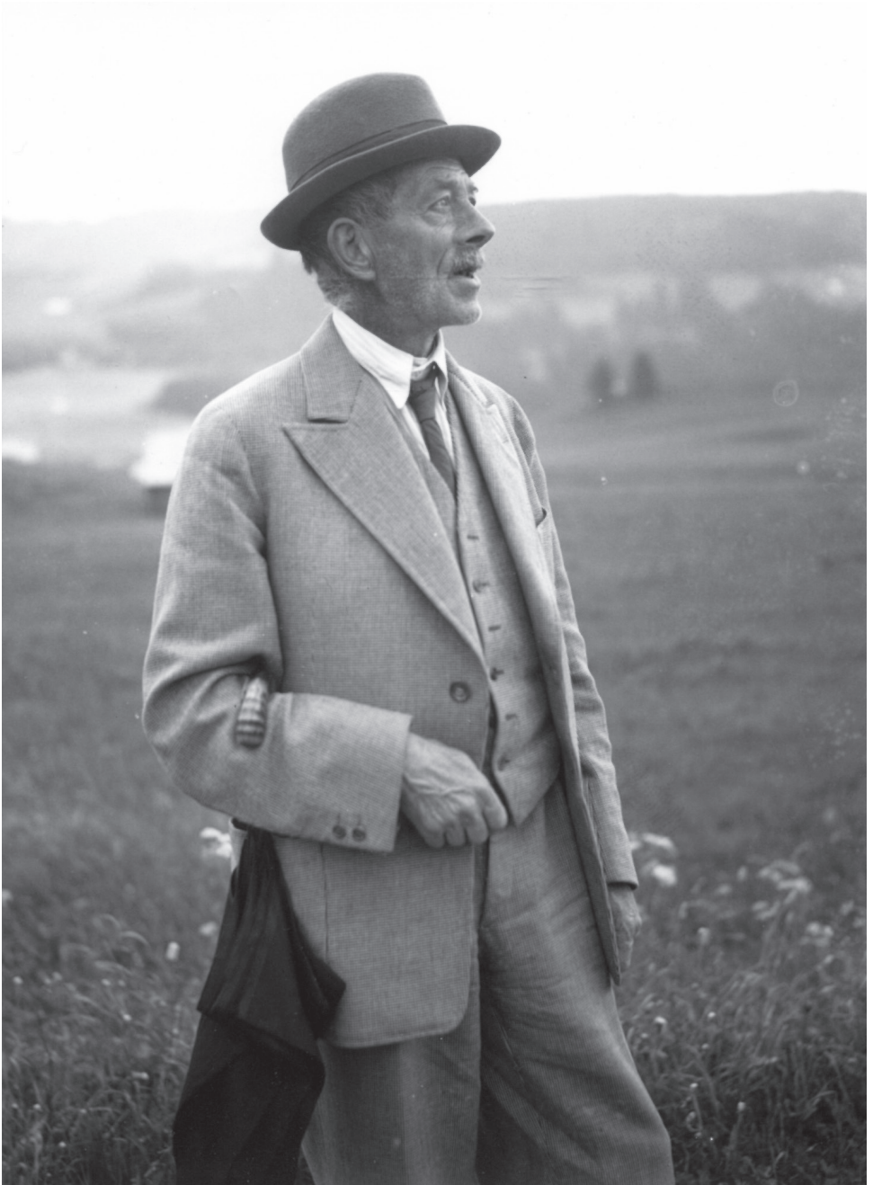
Robert Walser, fotografiert von Carl Seelig am 20. Juli 1941